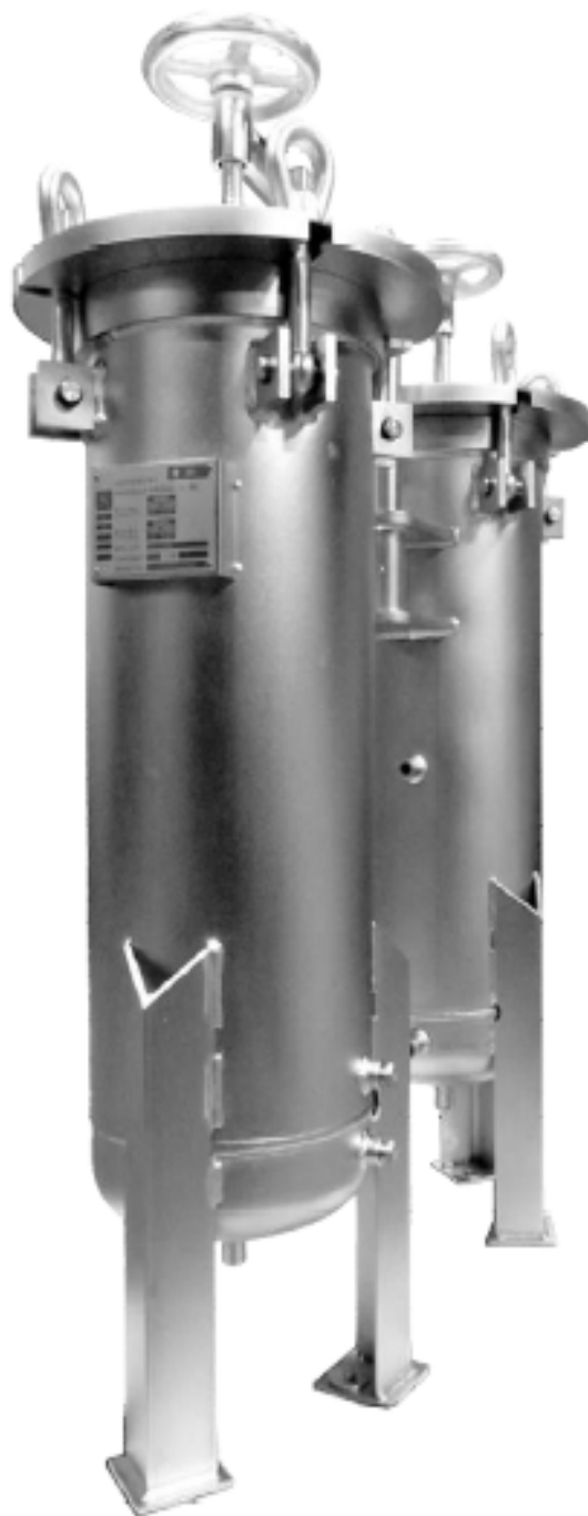
Filtre Multi-Cartouches Haut Débit Modèle 12 en Acier Inoxydable (Couvercle à Fermeture Par Boulon Basculant)